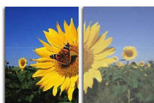
With SmartImage Without SmartImage

Το SmartImage είναι μια αποκλειστική τεχνολογία αιχμής της Philips που αναλύει τα περιεχόμενα που εμφανίζονται στην οθόνη σας και σας προσφέρει βελτιωμένη απόδοση προβολής. Το φιλικό προς το χρήστη περιβάλλον σας επιτρέπει να επιλέξετε διάφορους τρόπους λειτουργίας, όπως Office, Image, Entertainment, Economy κ.λπ., ανάλογα με την εφαρμογή που χρησιμοποιείται. Βάσει της επιλογής, το SmartImage βελτιώνει δυναμικά την αντίθεση, τον κορεσμό και την ευκρίνεια εικόνων και βίντεο για κορυφαία απόδοση προβολής. Η επιλογή της λειτουργίας Economy σας προσφέρει σημαντική εξοικονόμηση ενέργειας. Όλα σε πραγματικό χρόνο, με το πάτημα ενός μόνο κουμπιού!