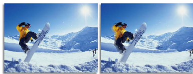
2ms GtG response time > 2ms GtG response time

SmartResponse 為 Philips 獨有的驅動科技，開啟時能自動調整響應時間來執行特定應用的需求，例如遊戲和電影需要較快的反應時間，以產生穩定流暢不抖動、沒有滯後時差及鬼影的影像