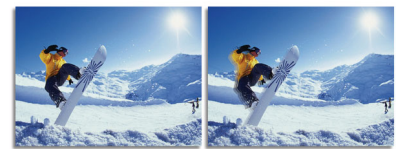
2ms GtG response time > 2ms GtG response time

SmartResponse è un'esclusiva tecnologia Overdrive di Philips che, una volta attivata, regola automaticamente i tempi di risposta in base ai requisiti specifici di applicazioni (ad esempio di gioco o per la visione dei film) che richiedono maggiore reattività. In questo modo si evitano sfarfallii, ritardi nella riproduzione delle immagini e l'effetto delle immagini "fantasma".