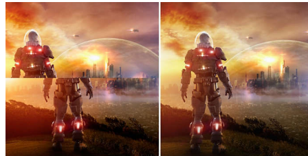
AMD FreeSync™ OFF (Battlegrounds)