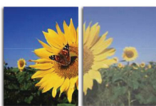
With SmartImage Without SmartImage