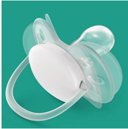
מגן רך וגמיש

עור של תינוק זקוק לטיפול ביתר זהירות. טכנולוגיית המעטה שלנו מאפשרת למוציץ הזה לעקוב אחר הקימורים הטבעיים של פני התינוק. תינוקך יחווה פחות סימנים על העור ופחות גירויים בלחיים.