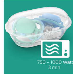
בצעו חיטוי תוך 3 דקות

שלנו, ultra soft 1-ultra air הנרתיק לנסיעות, המגיע עם מוצצי משמש גם כסטריליזטור. כל שעליכם לעשות הוא להוסיף מים ולהכניסו למיקרוגל. כך תוכלו להיות רגועים שהוא נקי לשימוש הבא.