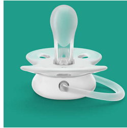
הפטמה עשויה מ-100% סיליקון

ultra soft 1- ultra air אנחנו בוחרים במודע בחומרי סיליקון עבור פטמות שלנו, מאחר שהוא חומר בטוח ונרפה, נמצא בשימוש ultra air חומרים נרחב ביישומים רפואיים ואינו מכיל כימיקלים מסוכנים, חומרים ואלרגנים (BPA) פעילים אנדוקריניים (למשל