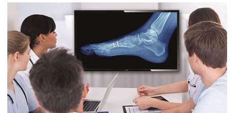
Imagem D clínica

Os monitores têm de apresentar imagens médicas de forma consistente e com alta qualidade para proporcionar interpretações fiáveis. A reprodução de imagens médicas em escala de cinzentos com monitores normais é - na melhor das hipóteses - maioritariamente inconsistente, o que os torna inadequados para utilização num ambiente clínico. Os ecrãs para avaliação clínica da Philips com predefinição para imagens D clínicas são calibrados de fábrica para fornecer um desempenho de apresentação padrão em escala de cinzentos compatível com a DICOM Parte 14. Ao utilizar painéis LCD de alta qualidade com tecnologia LED, a Philips oferece-lhe um desempenho consistente e fiável a um preço acessível. Para mais informações, consulte http://medical.nema.org/