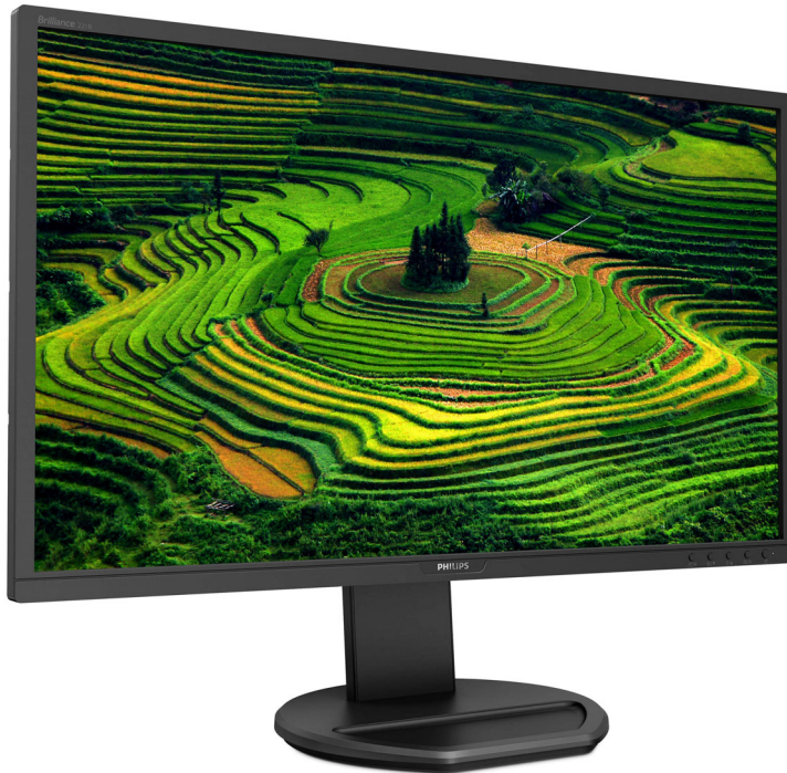
Imagen clara y rendimiento eficiente