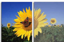
With SmartImage Without SmartImage