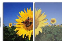
With SmartImage Without SmartImage

Το SmartImage είναι μια αποκλειστική τεχνολογία αιχμής της Philips που αναλύει τα περιεχόμενα που εμφανίζονται στην οθόνη σας και σας προσφέρει βελτιωμένη απόδοση προβολής. Το φιλικό προς το χρήστη περιβάλλον σας επιτρέπει να επιλέγετε διάφορους τρόπους λειτουργίας, όπως Office, Image, Entertainment, Economy κ.λπ., ανάλογα με την εφαρμογή που χρησιμοποιείται. Βάσει της επιλογής, το SmartImage βελτιώνει δυναμικά την αντίθεση, τον κορεσμό και την ευκρίνεια εικόνων και βίντεο για κορυφαία απόδοση προβολής. Η επιλογή της λειτουργίας Economy σας προσφέρει σημαντική εξοικονόμηση ενέργειας. Όλα σε πραγματικό χρόνο, με το πάτημα ενός μόνο κουμπιού!