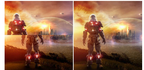
AMD FreeSync™ OFF (stuttering)