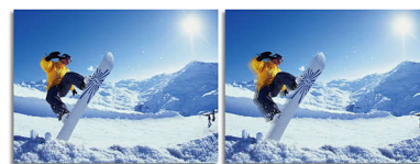
2ms GtG response time > 2ms GtG response time

SmartResponse е изключителна технология за ускоряване на Philips, която, когато е включена, автоматично регулира времето за реакция съобразно изискванията на конкретното приложение, например игра или филм, които изискват по-кратки времена за реакция, за да осигурят картина без трептене, без изоставане и без "паразитни образи"