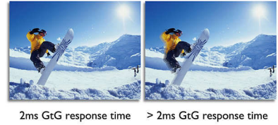
2ms GtG response time > 2ms GtG response time