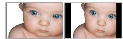
Widescreen format 4:3 format

ควบคุมรูปแบบภาพอัตโนมัติบนหน้าจอของ Philips ใช้สลับจากอัตราส่วนภาพแบบ 4:3 เป็นโหมดไวด์สกรีน และกลับเป็นแบบ 4:3 อีกครั้ง เพื่อให้อัตราส่วนภาพของหน้าจอเหมาะสมกับการทำงานกับเอกสารแบบกว้างโดยไม่ต้องเลื่อนหรือสำหรับการรับชมสื่อไวด์สกรีนในโหมดไวด์สกรีน และไม่บิดเบือนอัตราส่วนภาพของการแสดงผลโหมดเนทีฟแบบ 4:3