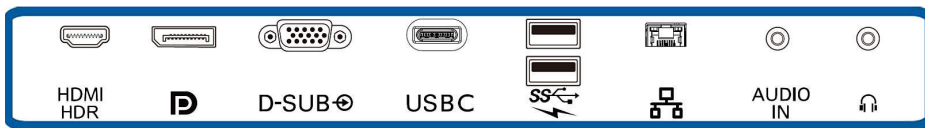
I/O back panel connector diagram