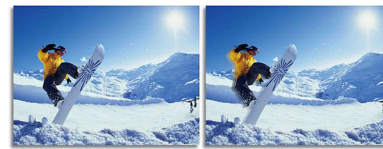
2ms GtG response time > 2ms GtG response time

SmartResponse е изключителна технология за ускоряване на Philips, която, когато е включена, автоматично регулира времето за реакция съобразно изискванията на конкретното приложение, например игра или филм, които изискват по-кратки времена за реакция, за да осигурят картина без трептене, без изоставане и без "паразитни образи"