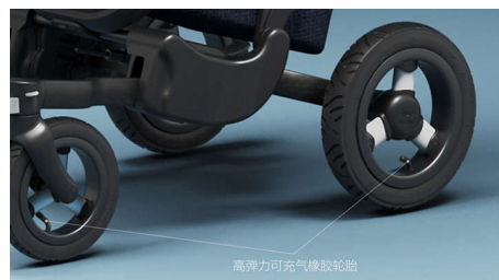
高弹力可充气橡胶轮胎