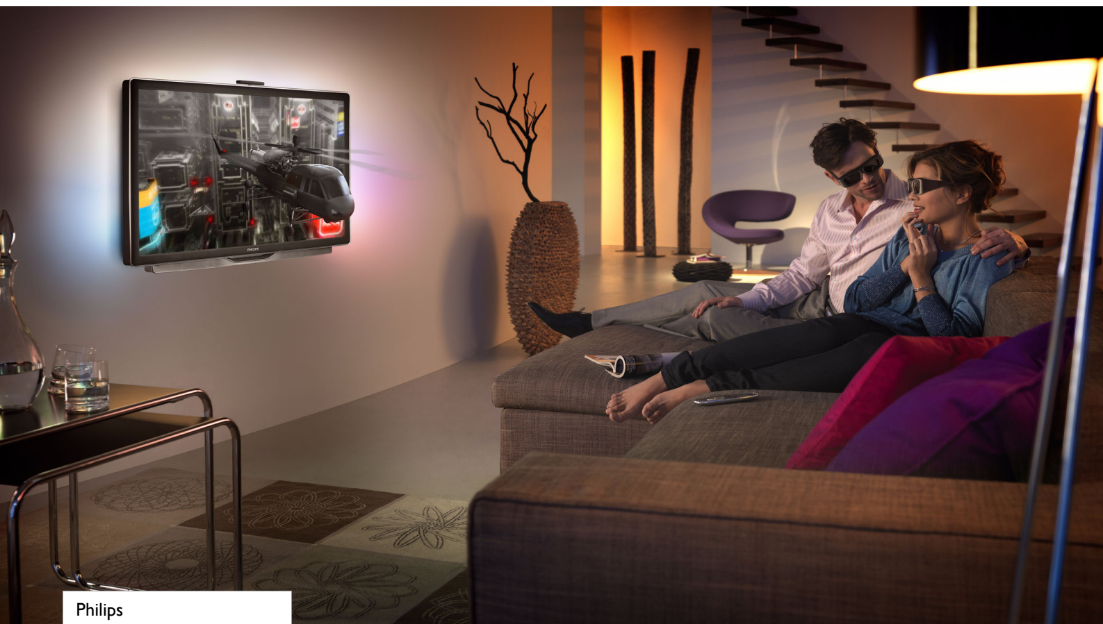
Philips 3D raidītājs