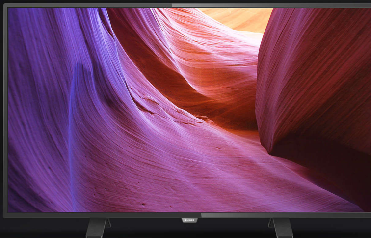
Philips 4900 series 49PUH4900 4K UHD Slim LED TV