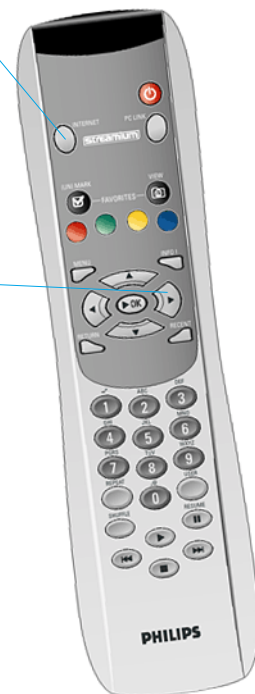
De Streamium SL300i/SL400i-afstandsbediening

2 Selecteer in het schermmenu Internet en kies Music (Muziek), Photos (Fotos), Movies (Films) of Games . Gebruik de pijltoetsen op de afstandsbediening om te bladeren.