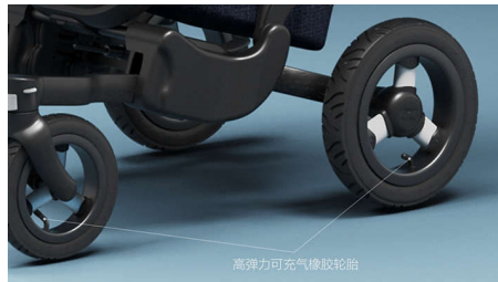
高弹力可充气橡胶轮胎