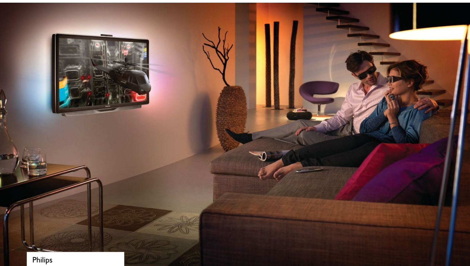
Philips Transmissor 3D

Desfrute de 3D no seu televisor Philips compatível com 3D