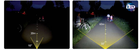
Standard 10 lux