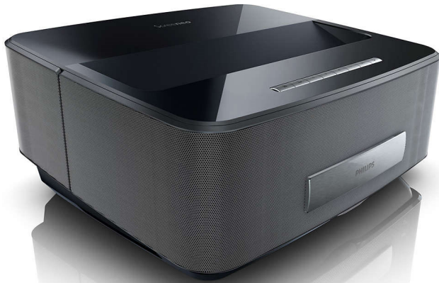
Imagen a lo grande

Disfruta del entretenimiento a lo grande: una imagen de entre 50 y 100 pulgadas con el proyector Screeneo a solo unos centímetros de la pared. Podrás moverlo por la casa fácilmente o instalar de forma sencilla un cine al aire libre en tu jardín. Además ofrece un sonido fantástico y Wi-Fi.