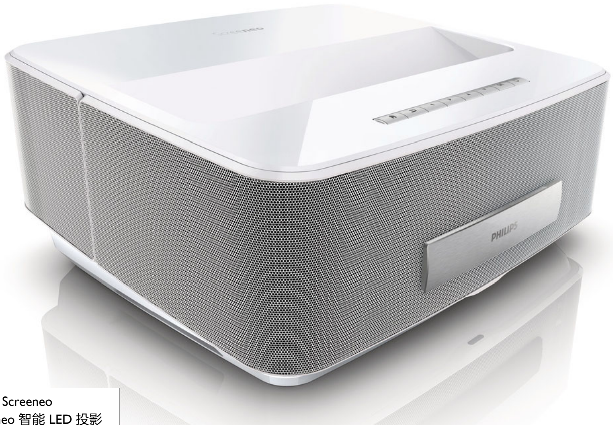
Philips Screeneo Screeneo 智能 LED 投影机