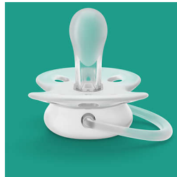
הפטמה עשויה מ-100% סיליקון

ultra soft 1-ultra air אנחנו בוחרים במודע בחומרי סיליקון עבור פטמות שלנו, מאחר שהוא חומר בטוח ונרפה, נמצא בשימוש ultra air נרחב ביישומים רפואיים ואינו מכיל כימיקלים מסוכנים, חומרים ואלרגנים (BPA) פעילים אנדוקריניים (למשל