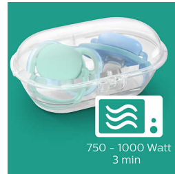
בצעו חיטוי תוך 3 דקות

שלנו, ultra soft 1-ultra air הנרתיק לנסיעות, המגיע עם מוצצי משמש גם כסטריליזטור. כל שעליכם לעשות הוא להוסיף מים ולהכניסו למיקרוגל. כך תוכלו להיות רגועים שהוא נקי לשימוש הבא.