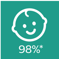
*אימוץ פטמה 98%

כשאלנו הורים כיצד התינוקות שלהם מגיבים לפטמות הסיליקון בעלות המרקם הרך שלנו, 98% בממוצע אמרו שהתינוק שלהם אוהב את מוצצי Philips Avent של ultra soft 1-ultra air מאמץ את מוצצי