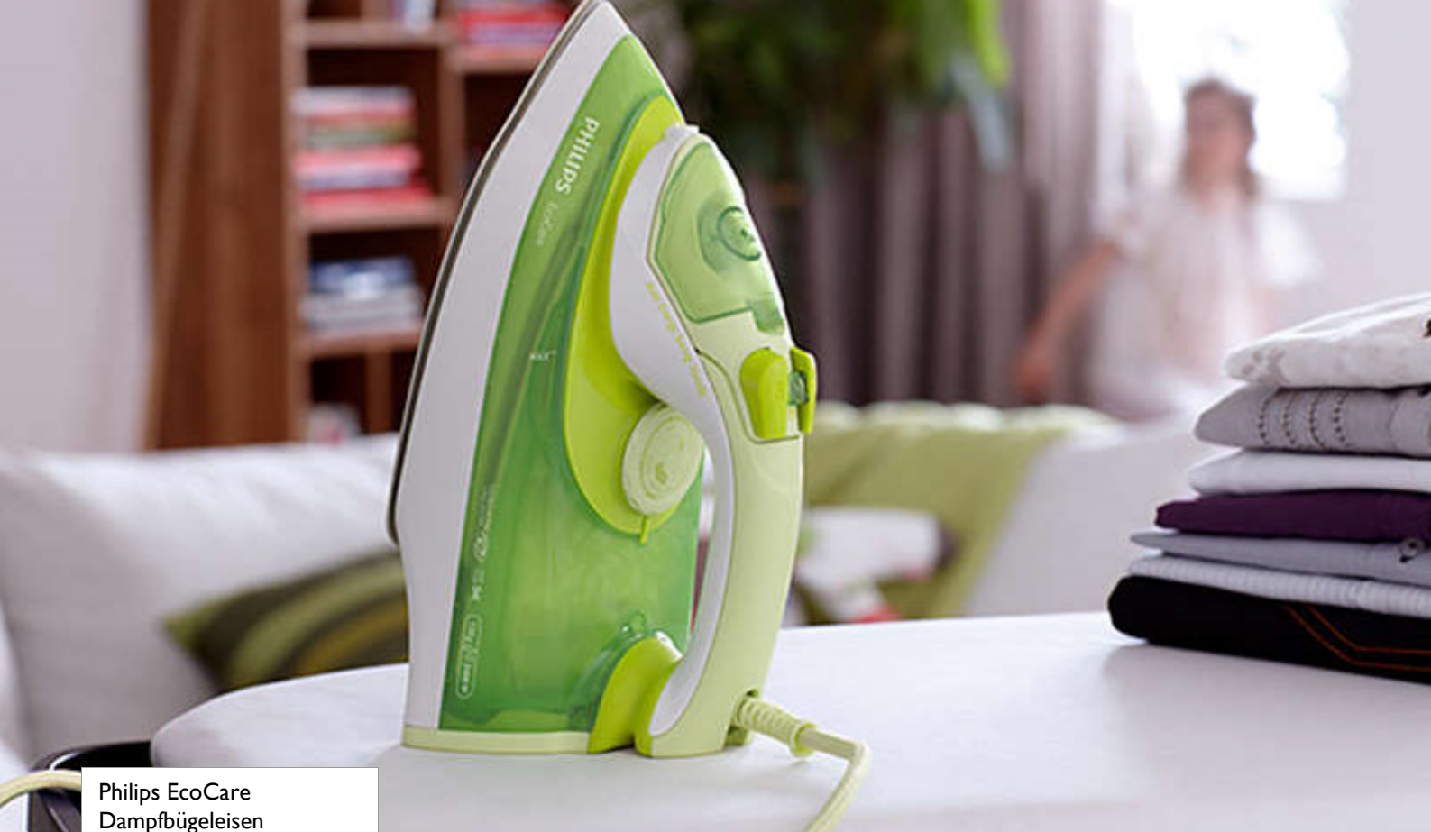
Philips EcoCare Dampfbügeleisen

100 % Dampfdruck bei 25 %* geringerem Energieverbrauch