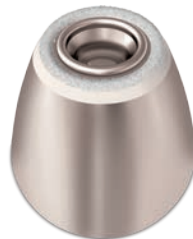
Normal treatment tip (SC6891)