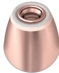
Sensitive treatment tip (SC6890)