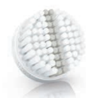
EXFOLIATION brush head (SC6022/00) エクスフォリエーションブラシ (SC6022/00)

3 Weekly exfoliation / 매주 각질 제거 / 週に1度の古い角質の除去