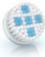
DEEP PORE brush head (SC6026/00) 毛穴ディープクレンジングブラシ (SC6026/00)

2 Special needs and care / 특별한 목적 및 관리 / 毛穴ケア