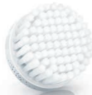
NORMAL brush head (SC6020/00) ノーマル肌用ブラシ (SC6020/00)