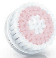
SENSITIVE brush head (SC6021/00) 敏感肌用ブラシ (SC6021/00)