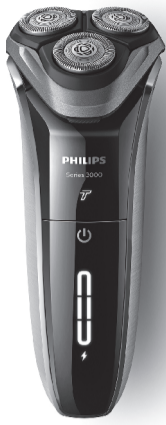
注：图示剃须刀仅代表 S4302, S4301, S3205, S3203