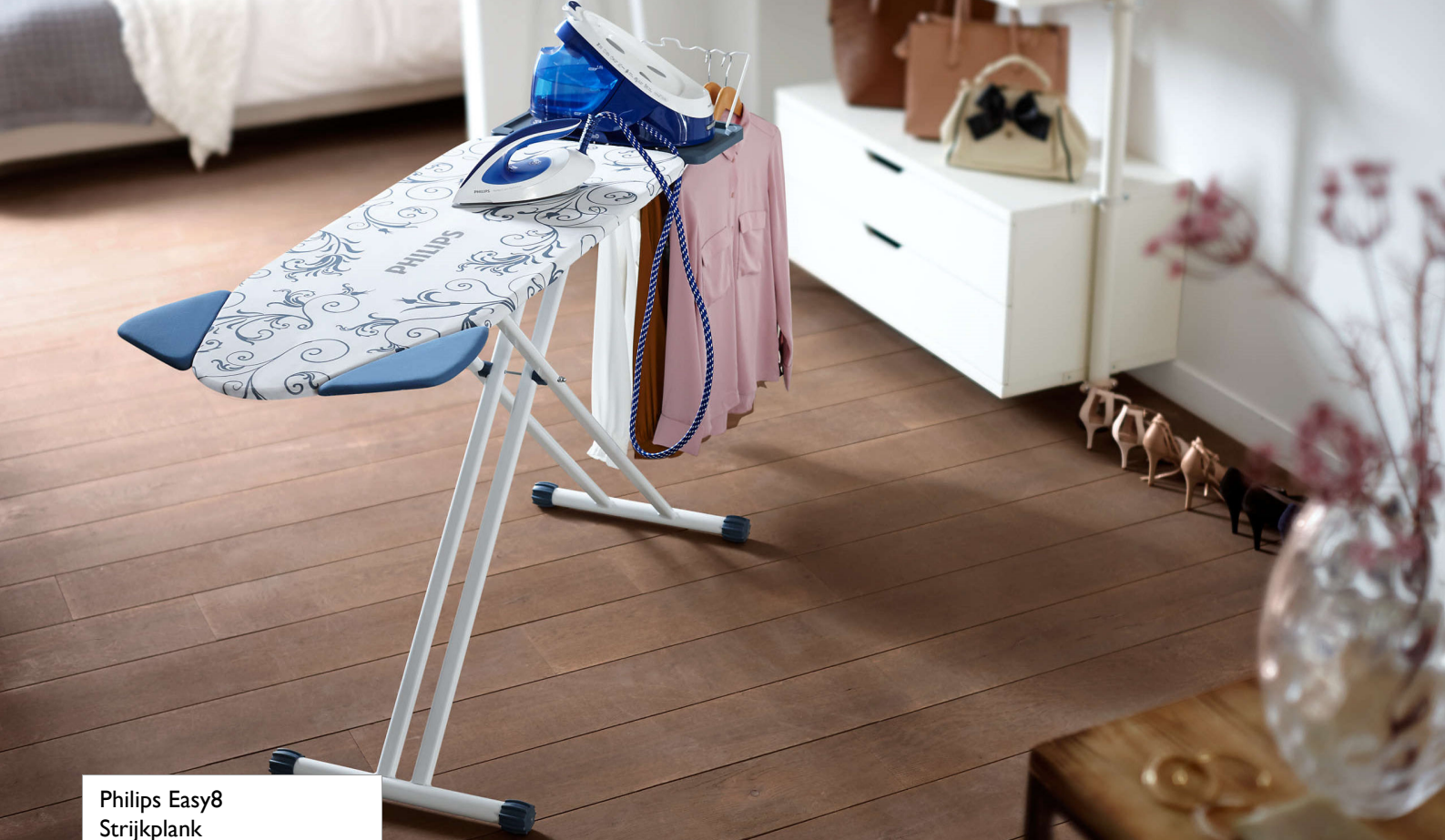
Philips Easy8 Strijkplank