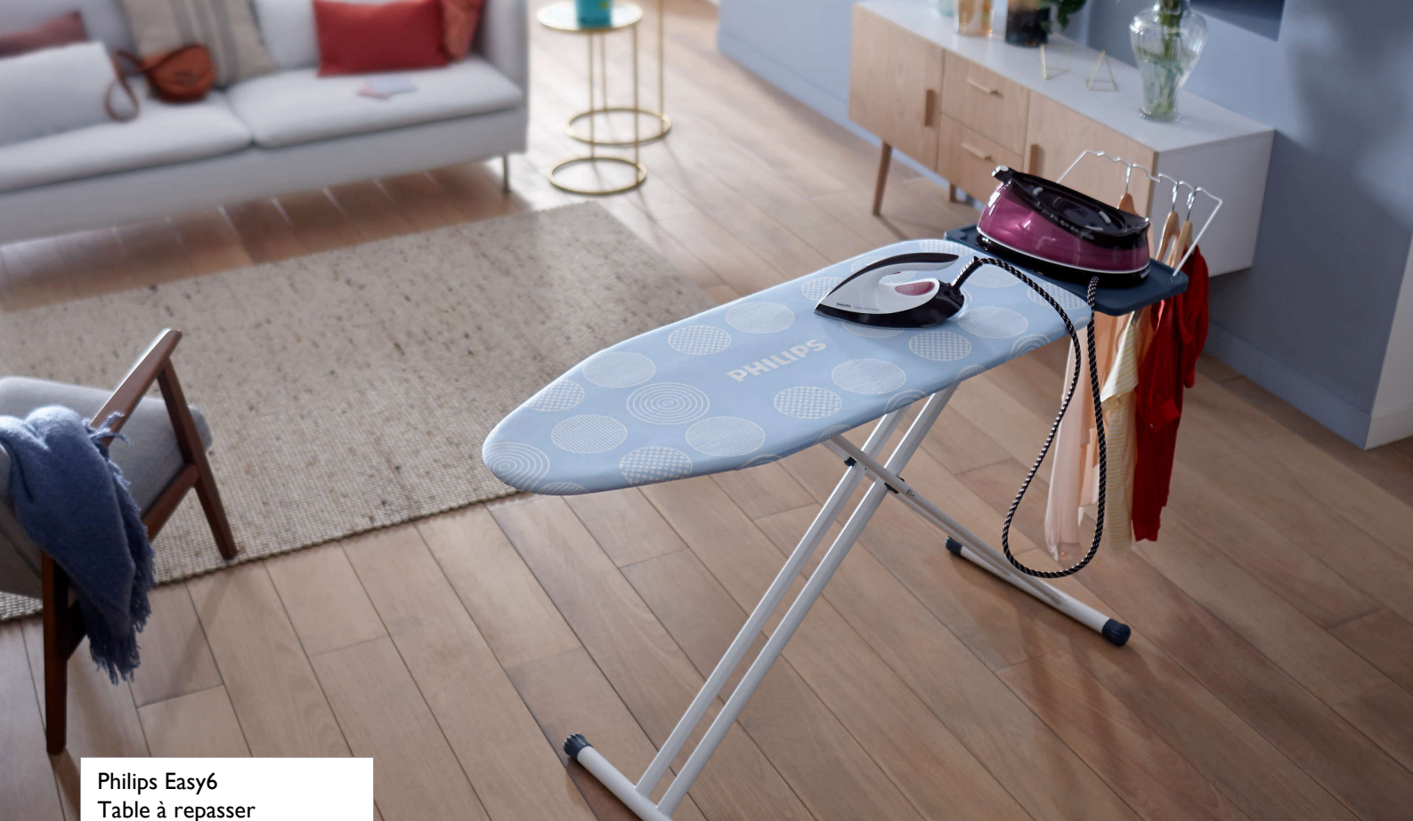
Philips Easy6 Table à repasser