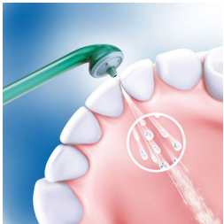
Kombination aus Luft und Mikrotröpfchen