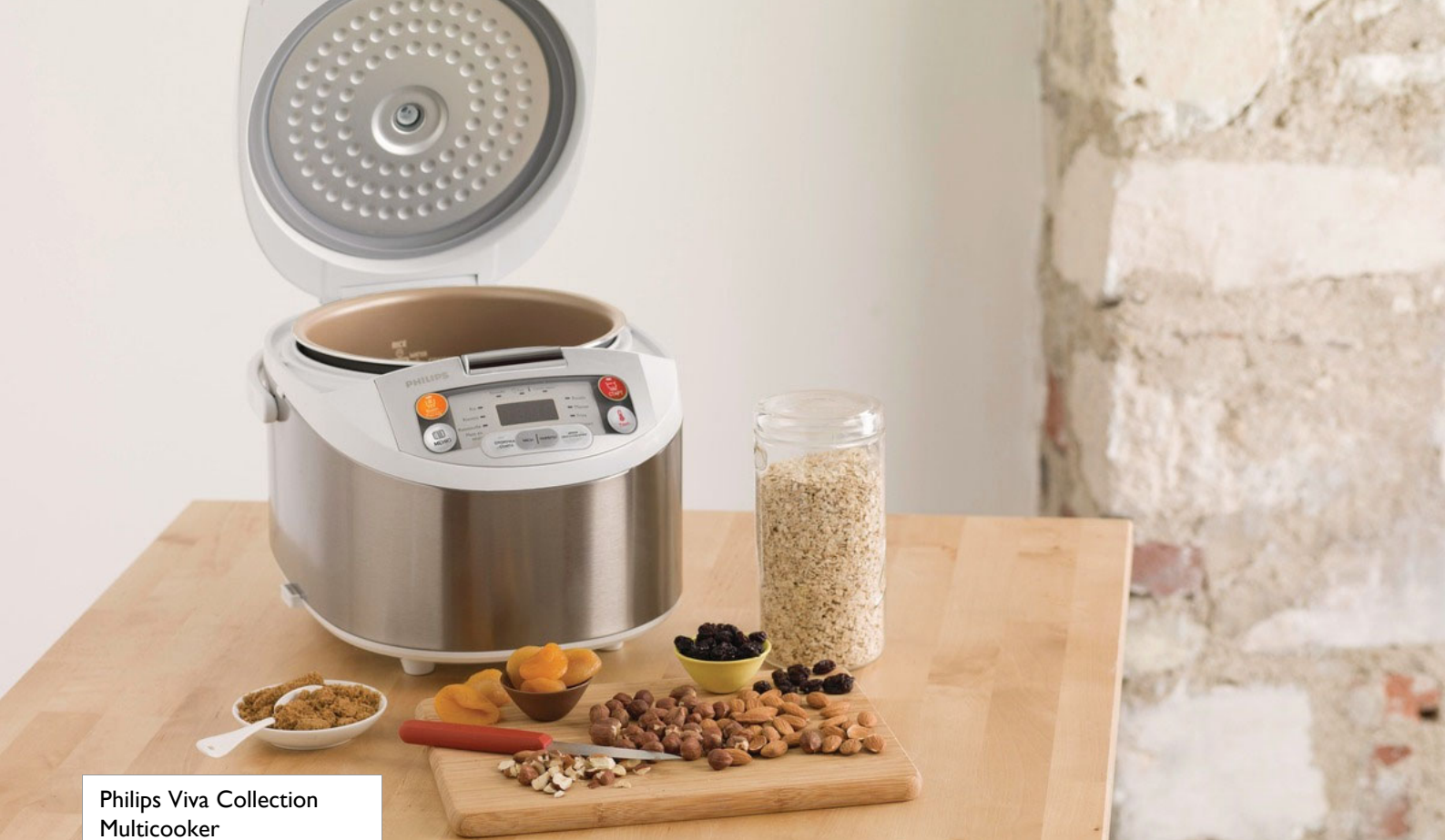
Philips Viva Collection Multicooker