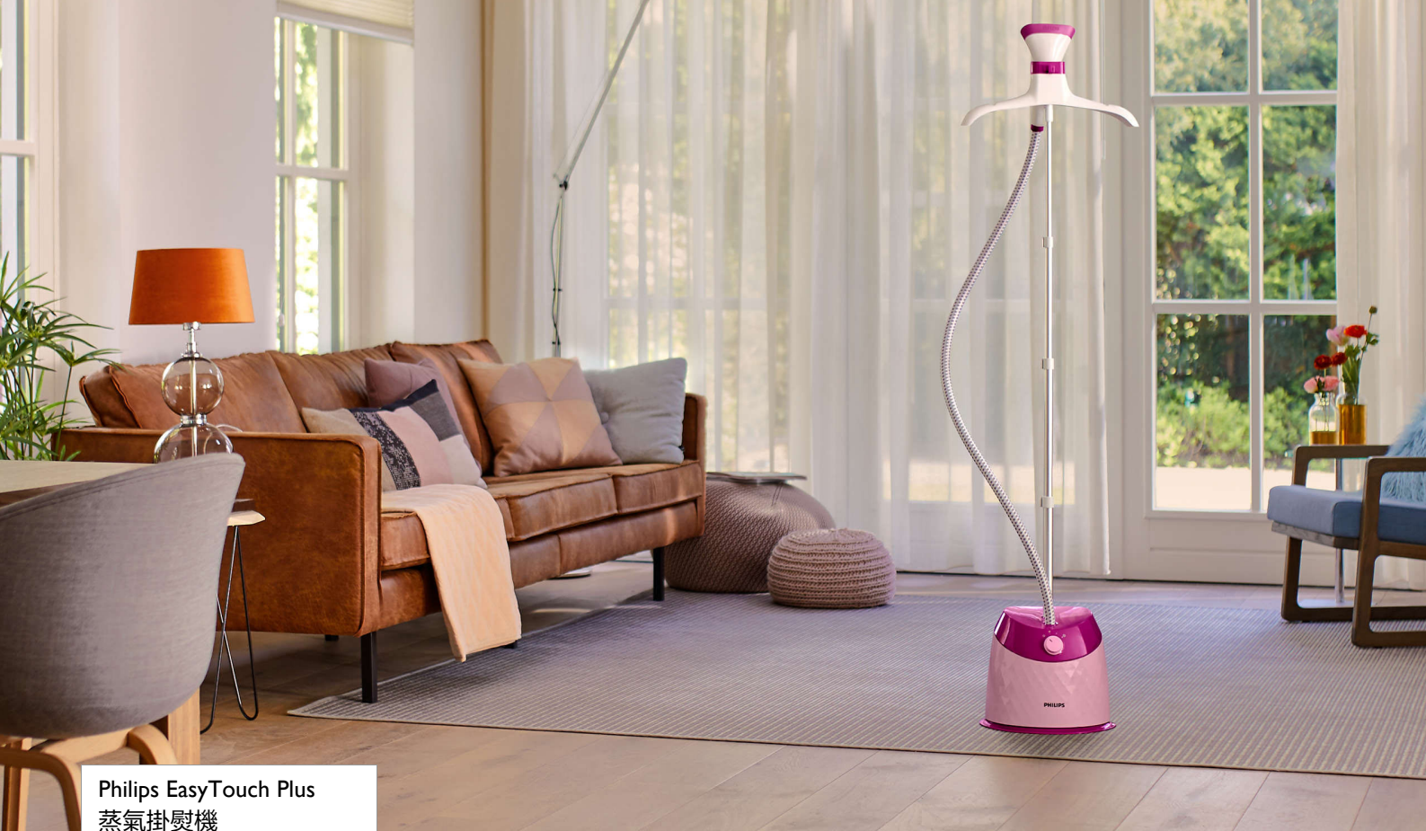
Philips EasyTouch Plus 蒸氣掛熨機