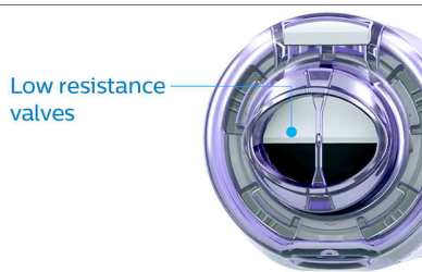
Low resistance valves

Die Ventile mit geringem Atemwiderstand öffnen selbst bei niedrigen Flussraten bei Kindern problemlos und ermöglichen eine leichte Atmung durch die Vorschaltkammer.*