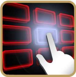
Bàn phím cảm ứng