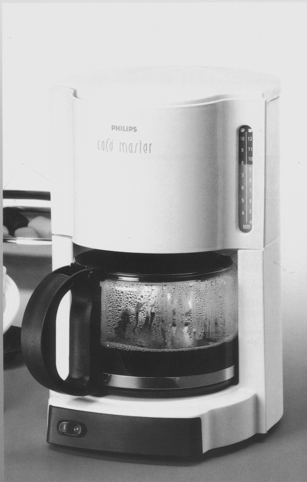
HD 7220/7221 Cafetera Café Master