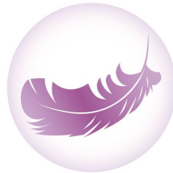
Lámina superior con sensación de seda y material transpirables y naturales. Probados dermatológicamente.