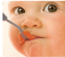
Recipe booklet Nutritious meals made easy