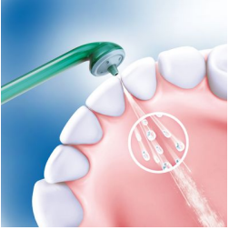
Kombination aus Luft und Mikrotröpfchen