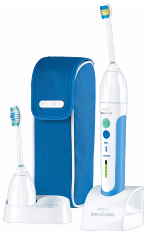
Philips Sonicare Genopladelig sonisk tandbørste