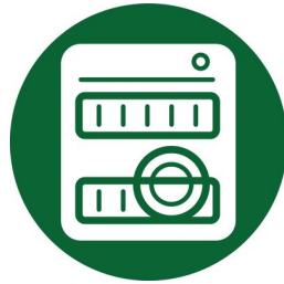
Vhodné na čistenie v umývačke riadu