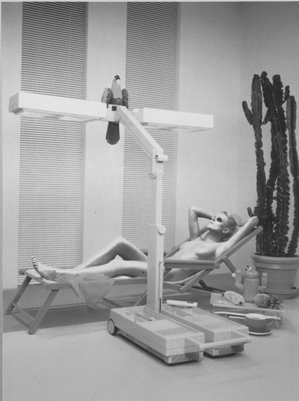
HP 3701 Solarium de cuerpo entero UVA