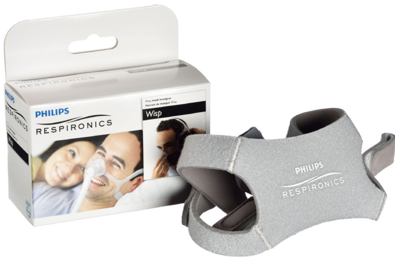
Philips Wisp Bretella di fissaggio